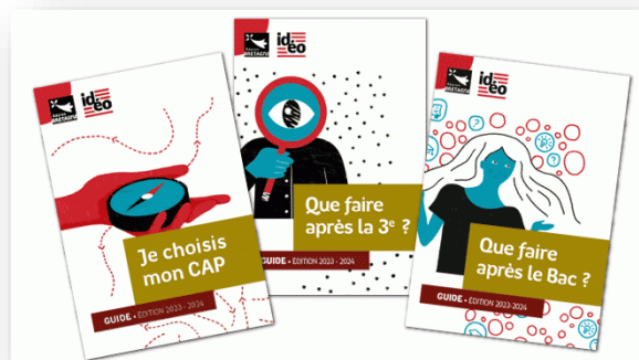
Les guides de la région Bretagne (éditions 2023-2024)