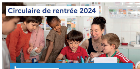
Circulaire de rentrée 2024

Pour le lycée, le module MonProjetSup permettra aux élèves de seconde, première et terminale de découvrir des formations correspondant à leurs centres d'intérêt . L'utilisation des données en open data de Parcoursup fournira des informations pertinentes aux élèves.